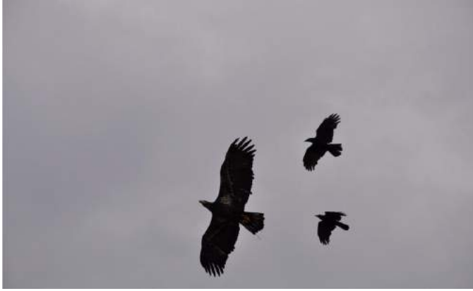
Figura 9. Un águila calva juvenil es acosada por cuervos durante un vuelo.