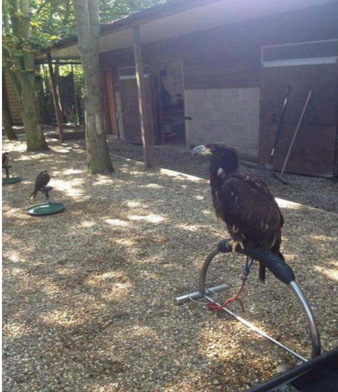
Figura 11. Se observa una percha en arco cubierta con goma. Nótese el anillo grande que se desliza por sobre la parte superior de la percha.