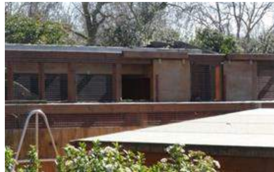
Figuras 5 y 6.