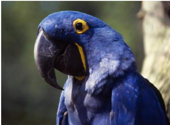
Figura 20. El guacamayo jacinto alcanza su madurez sexual a los 5 o 6 años de edad.

Algunas especies como el guacamayo jacinto ( Anodorhynchus hyacinthinus ) (Figura 20), se demoran un par de años antes de alcanzar la madurez sexual. Puede ser beneficioso para el ave y para generar un mensaje educativo, que ella participe dentro de actividades educativas en vivo si es que puede incluirse en vuelos libres y ejercitarse antes de ingresar a un programa de reproducción. Para esta especie, sus necesidades sociales deben recibir las mismas consideraciones que para las otras especies. Si es que las aves vuelan juntas, el vuelo libre facilitará establecer un vínculo entre parejas antes de la reproducción.