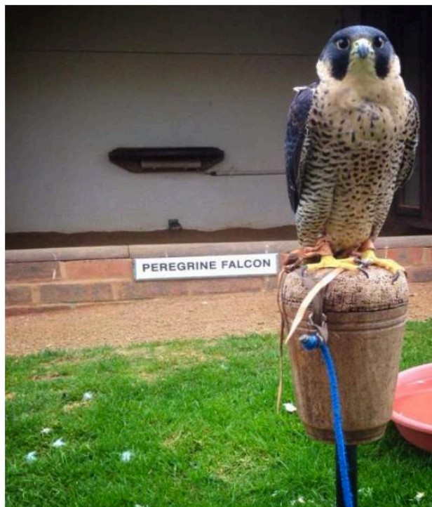
Figura 10. Halcón peregrino sobre una percha “banco” de características apropiadas.