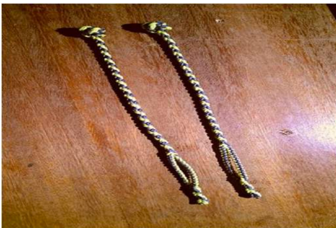
Figura 8. Pihuelas trenzadas para cambio de plumaje