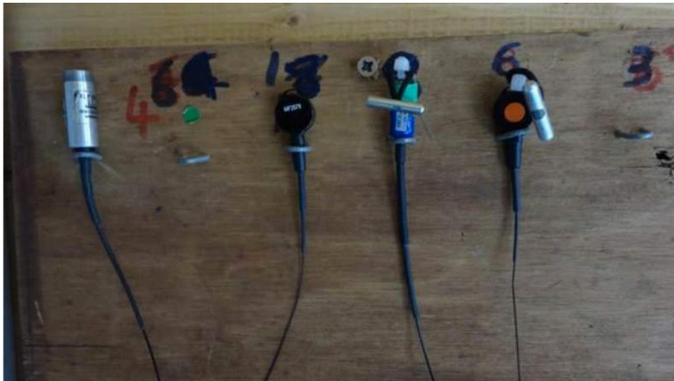
Figura 15. Diferentes transmisores, los más pequeños en este caso se fijan al ojal de las tobilleras del ave.

Para especies más pequeñas como cernícalos ( Falco tinnunculus ), esmerejones ( Falco columbarius ), lechuzas campanario ( Tyto alba ), o especies de tamaño similar, se deben utilizar transmisores más livianos. Es importante considerar un equilibrio entre seleccionar un transmisor liviano con su capacidad para proveer un rango significativo que permita el rastreo de incluso las especies que pueden volar largas distancias y aumentar sorprendentemente la altura en muy poco tiempo.