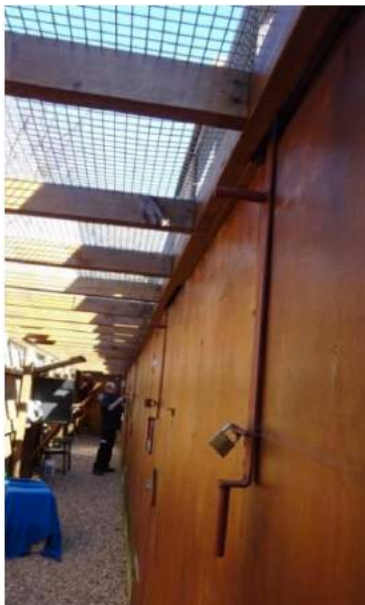
Figura 7. Sistemas de bloqueo y apertura de puertas correderas

En base al sistema mostrado en las figuras 5 y 6, el énfasis en la seguridad recae en el personal de demostraciones y en los protocolos específicos que se deben implementar y seguir. Cuando se libera un ave, el acceso debe cerrarse de manera inmediata para evitar que re-ingrese si es que el ave se devuelve por otra ruta. (Muchas aves pueden volar pasando por las puertas de su recinto hacia un guante o un área temporal de espera hasta que finalice la demostración). Si el ave se devuelve a su recinto, el acceso de ingreso/salida debe ser cerrado inmediatamente. La ubicación del acceso y la visibilidad del ave al momento de volar ya sea hacia o desde una persona del equipo de demostraciones son fundamentales para que el programa sea exitoso. Deben existir seguros o sistemas de bloqueo sencillos de operar en las puertas de acceso (Fig. 7).