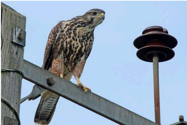
Figura 19. Híbrido entre un busardo mixto que escapó y un gavián silvestre en Reino Unido.

En los peores casos, han habido situaciones en las que las aves que escapan se han hibridado con otras especies (por ejemplo, un busardo mixto de cetrería se escapó y se apareó con un gavián silvestre, el polluelo ahora reside en la reserva de Amwell RSPB en el Reino Unido, y fue apropiadamente llamado como "Hazzard" ("Azar" en inglés) (Figura 19).